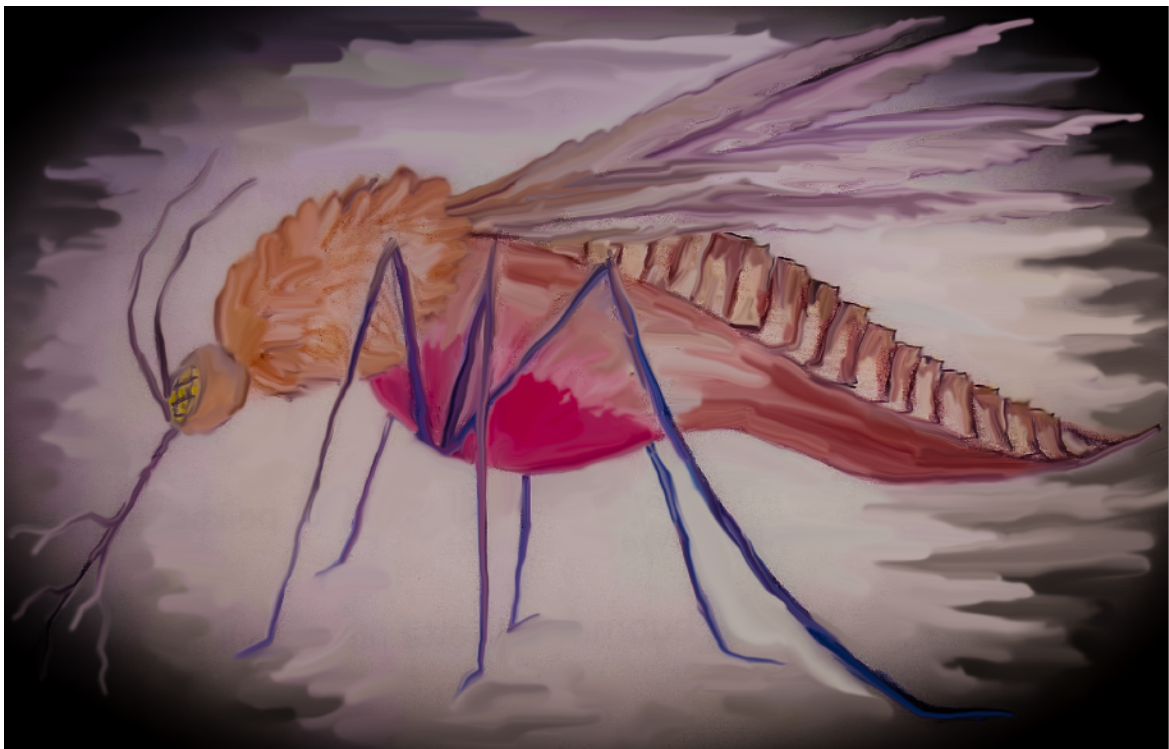
Piirroskuva Jaana Tolonen

Lisää painoa tuovat peikot, jotka istuvat selässä hammassaalis mukanaan. Lisäksi peikot roikkuvat selässä sikin sokin miten sattuu, ja sylkevät syövyttävää räkälimaansa ympäri metsää.